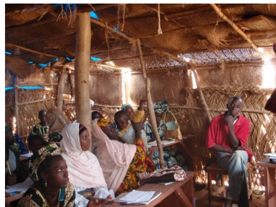
Wir haben Schulbänke!